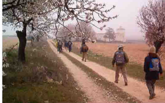
Llegando a Hoya Murciana