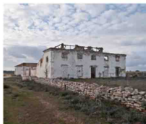
Casa de las Monjas