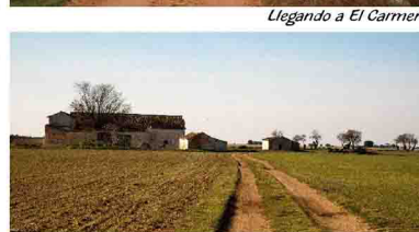
Casa de MariHernández (Camino a Santiago)