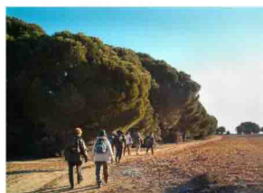
Por El Portillejo de camino a El Carmen