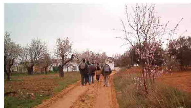
Llegando a El Carmen