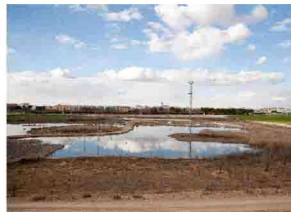
"Laguna de los patos"