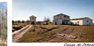
Casas de Ortega