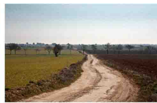
Camino Romano, al fondo la casa Taberneros