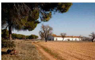
Casa de la Generala