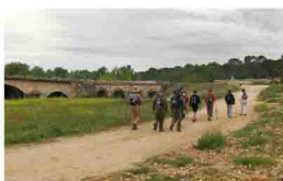
Puente de El Carrasco