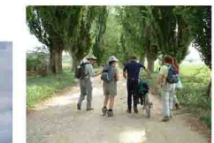
Camino de El Galapagar