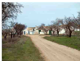
Casa del Olmo