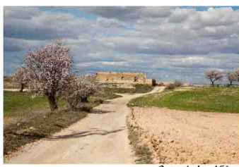
Casa de Las Viñas