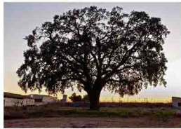
Encina en casa de El Alcalde