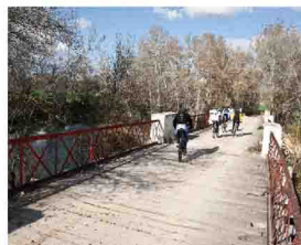
Puente de Quitapellos