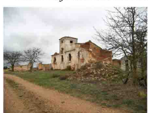
Casa de los Gujarrales