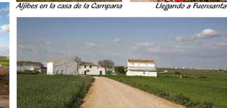
La Dehesica, al fondo La Roda