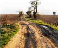
Camino de las higueras